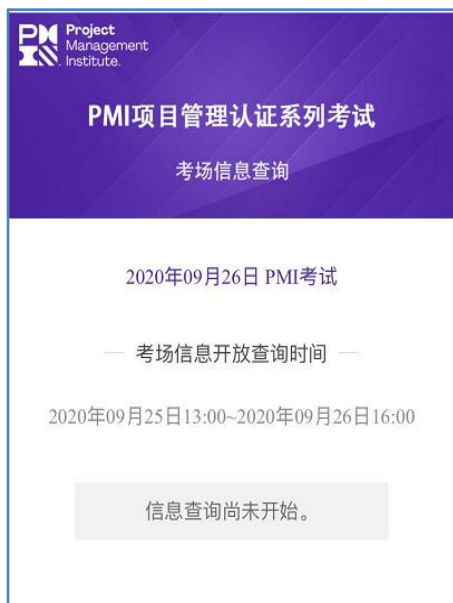
(图三 信息查询尚未开放)