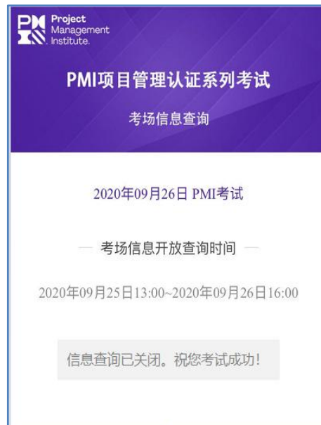
(图四 信息查询已关闭)