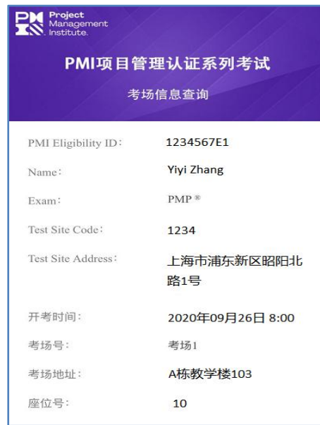
(图二 考场信息查询界面)